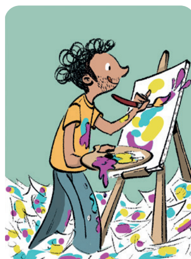
Teken en schilder!