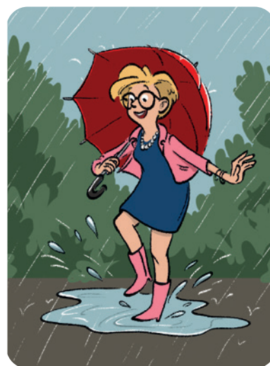
Stamp in een plas!