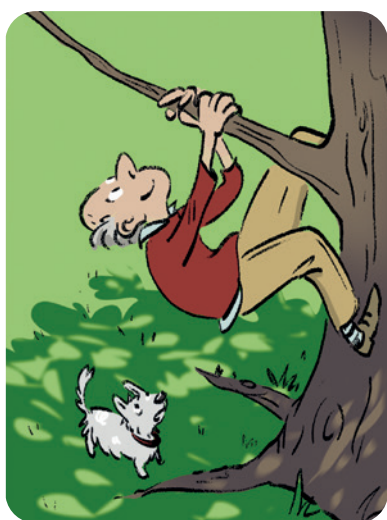
Klim in een boom!