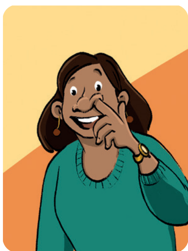
Peuter in je neus!