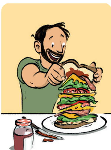
Beleg je brood lekker dik!